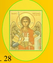
Vol. 12. No. 28