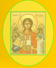
Vol. 12. No. 27