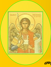
መበል 12 ዓመት ቍጽራ .27